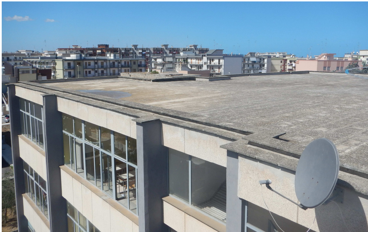
Foto della copertura