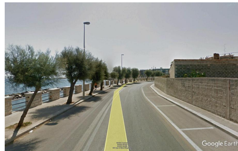
Documentazione fotografica