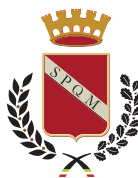
Comune di Molfetta Assessorato alla Socialità